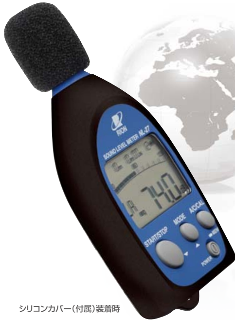
シリコンカバー(付属)装着時